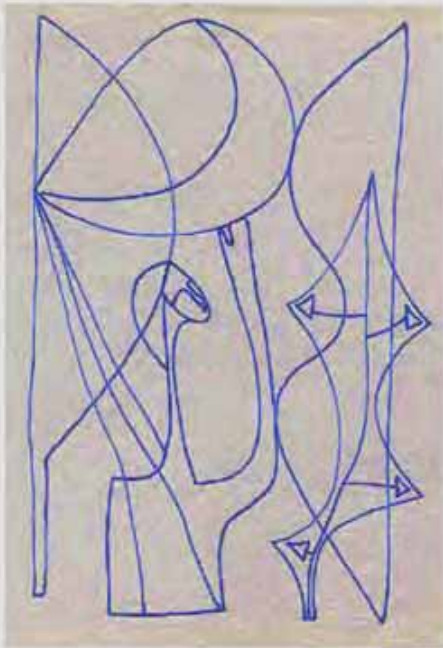
Dessin à l'encre bleue, non signé, 21,5 x 17,5 cm Provenance : Atelier de l'artiste