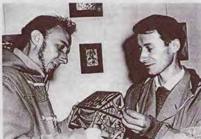
Dans l'atelier de Paul Corrigan Exposition Mirande 1958

« Plongeur infatigable, l'art se jette nu dans des abîmes, se fraie des chemins de délire, se donne des lectures pour soi seul, à la limite de l'abstraction, mais lyrique, mais conquérante. L'œuvre s'en nourrira, nous serons plusieurs, un jour, à partager la saveur unique de l'œuvre.